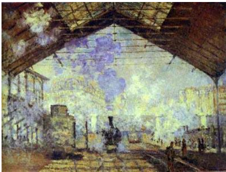
Figura 1: La stazione di Saint-Lazare ; C. Monet, 1877; olio su tela, Museo d'Orsay, Parigi

2-L'opera presentata in Figura 1 è espressione di un'importante innovazione che influenza un particolare ambito produttivo: spiega brevemente di quale innovazione si tratta indicando l'ambito di influenza e le conseguenze.